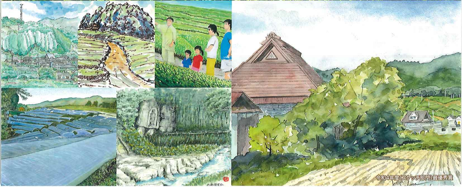
令和4年度(スケッチ部門)最優秀賞