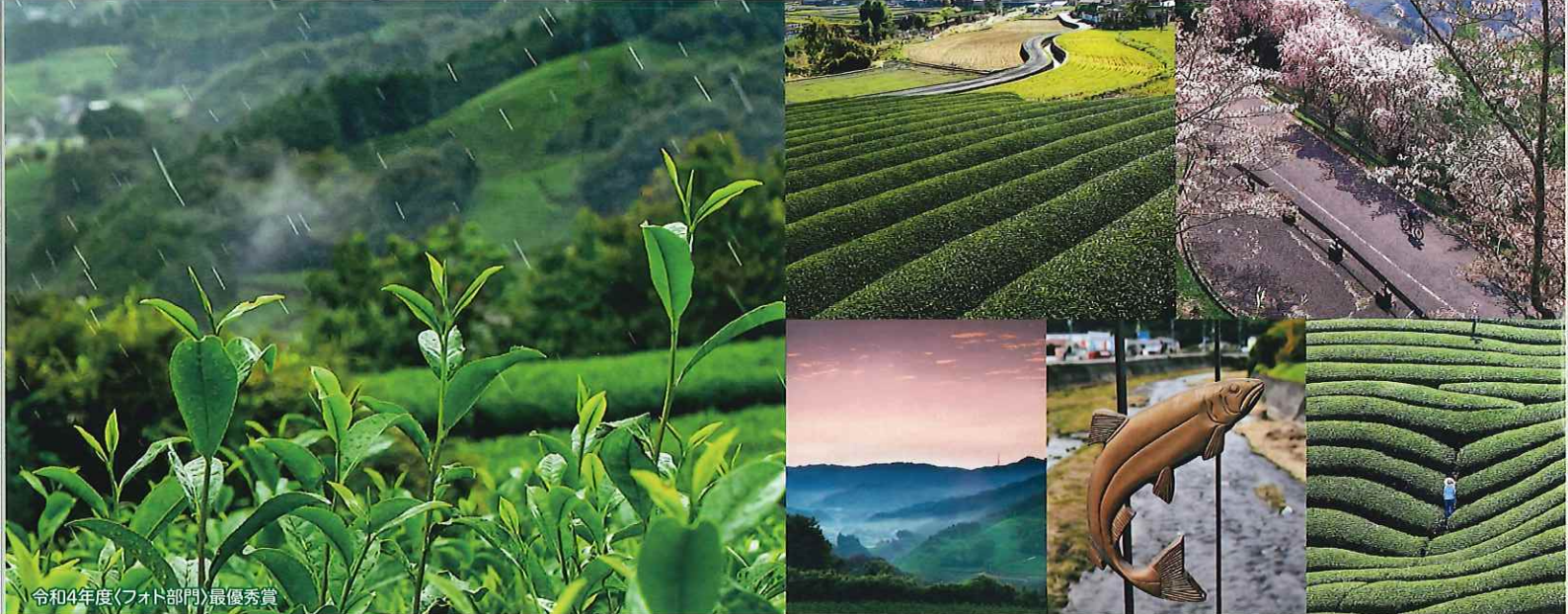
令和4年度(フォト部門)最優秀賞